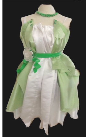
فستان منفض بطريقة إعادة التدوير بعد تطبيق البرنامج