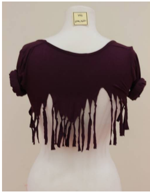
بلوزة منقذة بطريقة إعادة التدوير بعد تطبيق البرنامج