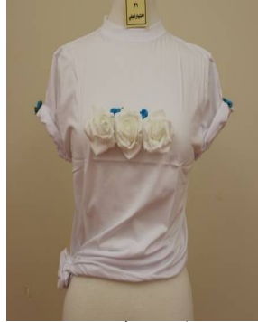
بلوزة منفضة بطريقة إعادة التدوير قبل تطبيق البرنامج