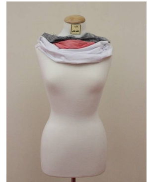
شال منقذ بطريقة إعادة التدوير قبل تطبيق البرنامج