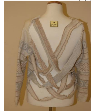
بلوزة منفضة بطريقة إعادة التدوير بعد تطبيق البرنامج