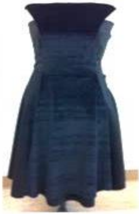
فستان منفذ بطريقة إعادة التدوير بعد تطبيق البرنامج