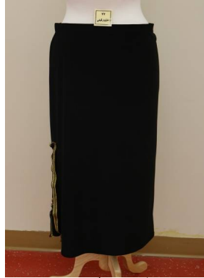
تنورة منفضة بطريقة إعادة التدوير قبل تطبيق البرنامج