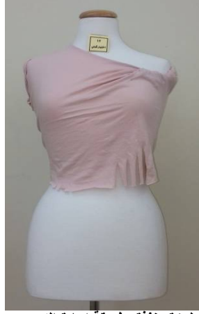
بلوزة منفضة بطريقة إعادة التدوير قبل تطبيق البرنامج