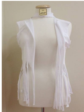
بلوزة منقذة بطريقة إعادة التدوير قبل تطبيق البرنامج