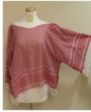
بلوزة منقذة بطريقة إعادة التدوير بعد تطبيق البرنامج