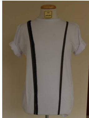
بلوزة منفضة بطريقة إعادة التدوير قبل تطبيق البرنامج