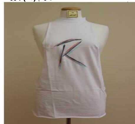
الشكل رقم (14) بلوزة منقذة بطريقة إعادة التدوير قبل (يمين) وبعد (يسار) تطبيق البرنامج