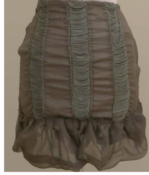
تنورة منفضة بطريقة إعادة التدوير بعد تطبيق البرنامج

أو الأزياء المستعملة، والأشكال التالية نماذج من بعض التصاميم المنفضة قبل وبعد تطبيق البرنامج: