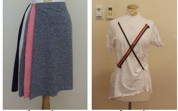
الشكل رقم (15)

- توجد فروق ذات دلالة إحصائية بين الاختبار القبلي والبعدي في المجموعة التجريبية في مهارة التفاصيل لصالح الاختبار البعدي، حيث بلغ معامل T (- 54.50) عند درجة حرية (449) ومستوى دلالة (0.00) وهو أصغر من (0.05).