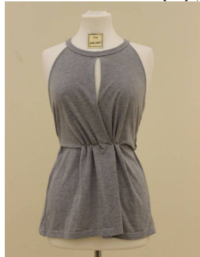
بلوزة منقذة بطريقة إعادة التدوير بعد تطبيق البرنامج