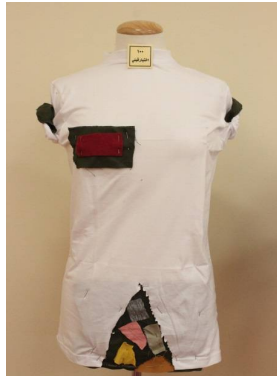
بلوزة منقذة بطريقة إعادة التدوير قبل تطبيق البرنامج