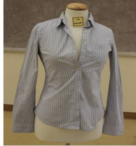
الشكل رقم (13) بلوزة منقذة بطريقة إعادة التدوير قبل (يمين) وبعد (يسار) تطبيق البرنامج