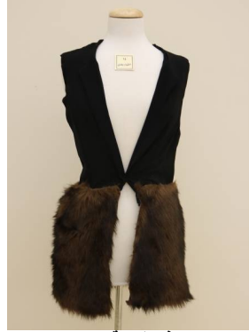
صديري منفض بطريقة إعادة التدوير بعد تطبيق البرنامج