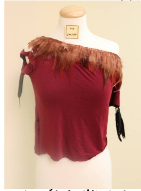
بلوزة منقذة بطريقة إعادة التدوير بعد تطبيق البرنامج